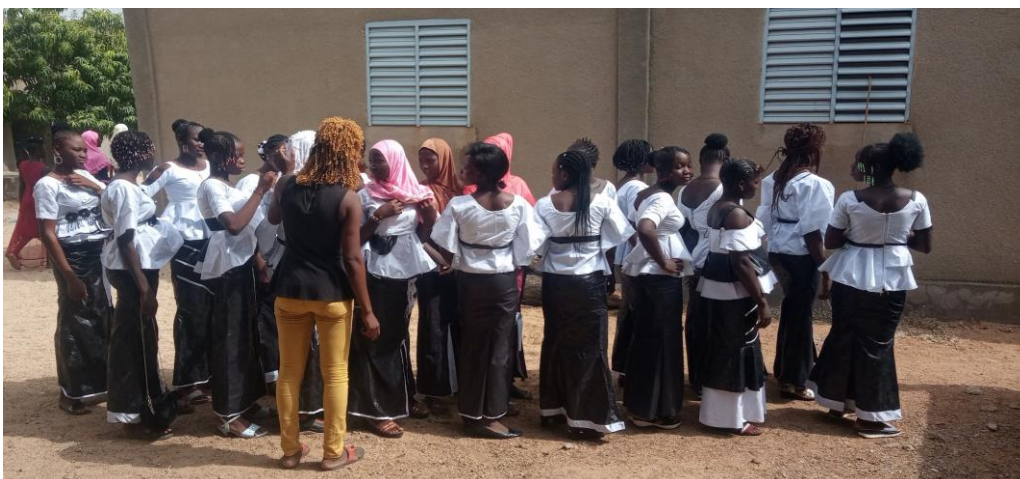
Laatste instructies voor het lopen van de modeshow op 3 juni

Net nadat deze nieuwsbrief gepubliceerd is, zal Help Burkina een kraam bemensen op het Afrikafestival in Hertme op 1 juli. Het is de eerste keer; de tip kregen we van een donateur. Natuurlijk zal de gehele opbrengst van de verkoop van spullen en plantjes (uit Afrika ja) ten goede komen aan het CPWB.