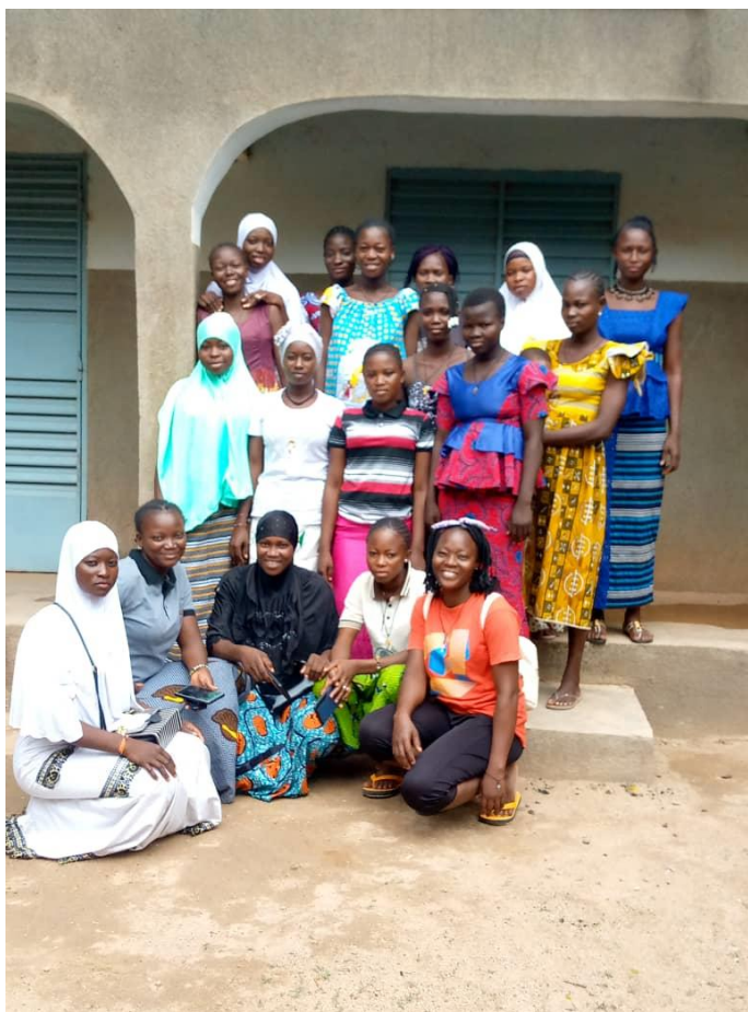
De geslaagde cursisten van 2023/2024

Wilt u onze nieuwsbrief voortaan ook ontvangen? Stuur dan een mail aan helpburkina@gmail.com o.v.v. "aanmelding nieuwsbrief".